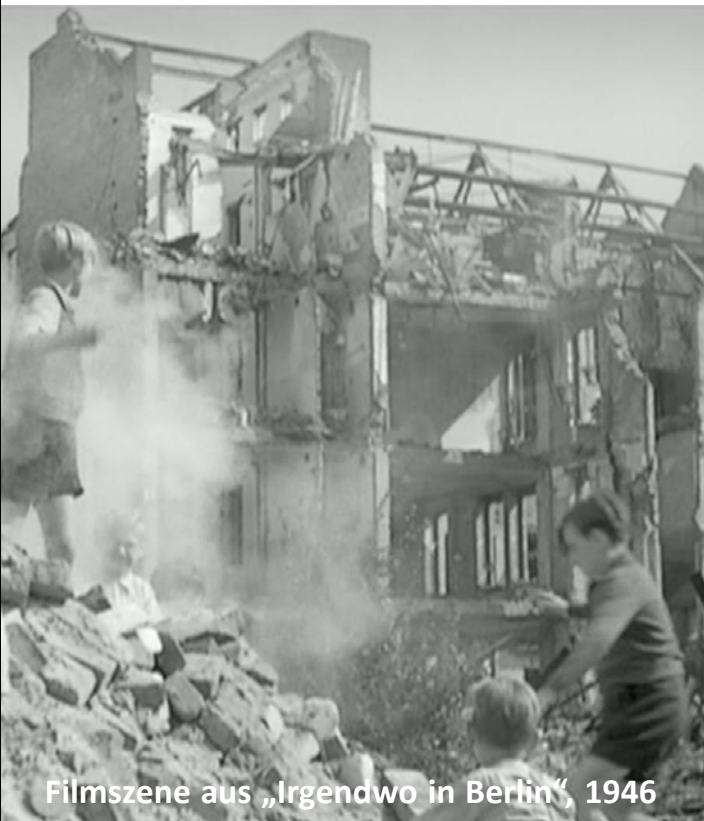
Filmszene aus „Irgendwo in Berlin“, 1946